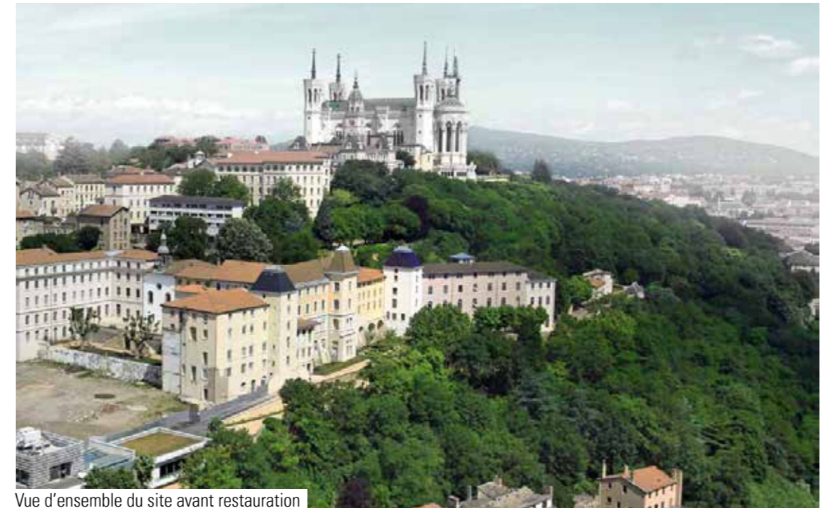
Vue d'ensemble du site avant restauration