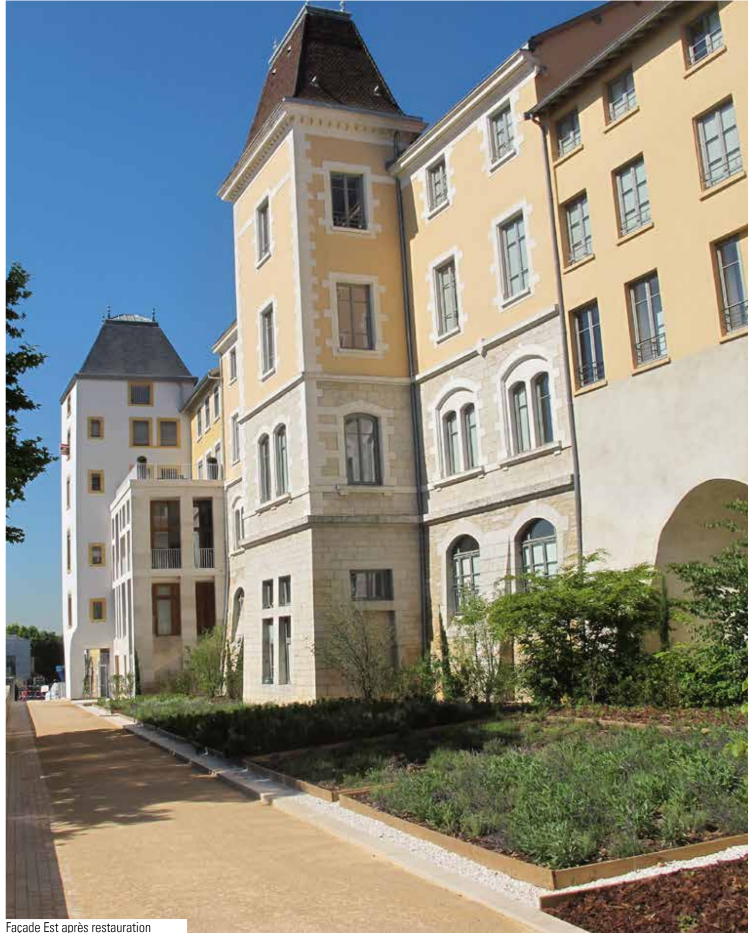
Façade Est après restauration