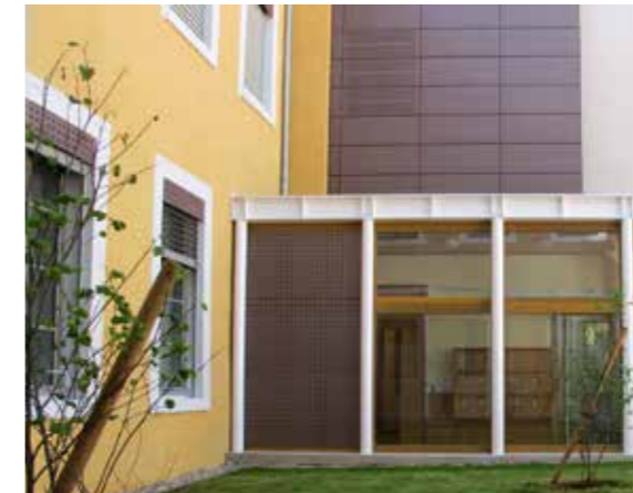
Détail du traitement des menuiseries et de la restauration de la façade intérieure Ouest

Maître d'oeuvre: Detry-Levy&Associés (mandataires), TECO (BET structure), ILIADE ingénierie (BET fluide), VOXOA (BET économie), Cabinet Roland Starace (BET ACOUSTIQUE), BET KATENE (AMO HQE), ANAHOME Immobilier (AMO)