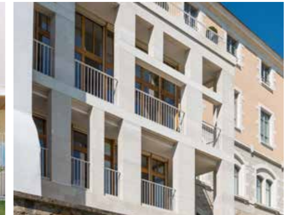
Détail de la nouvelle extension en pierre, façade extérieure Est.